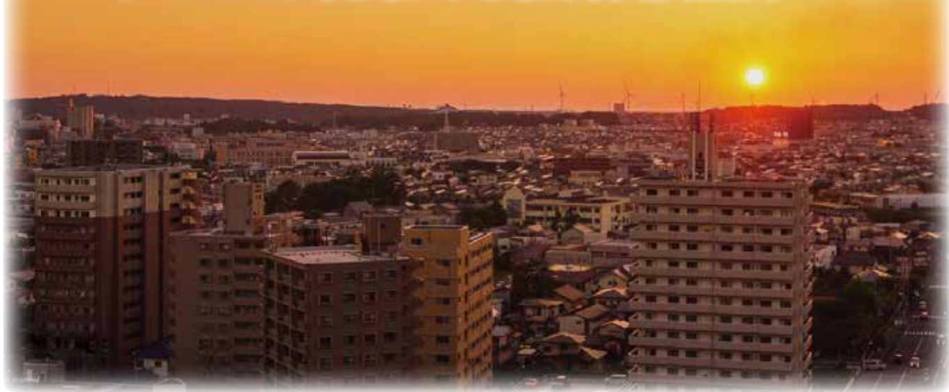
〈秋田市中央地域 千秋公園からの夕日〉